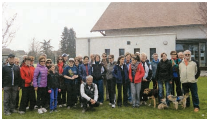
les marcheurs de l'après-midi.