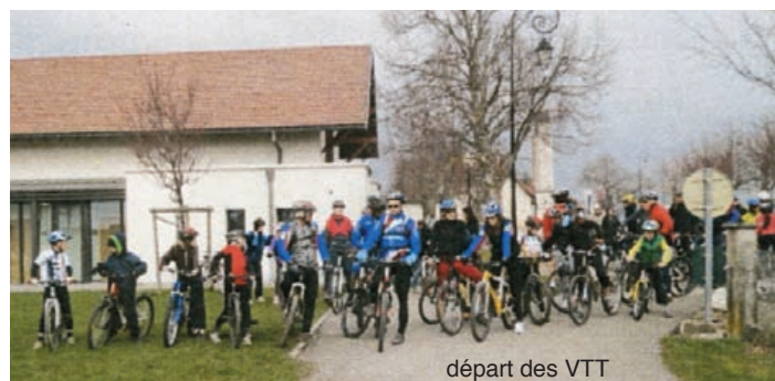
départ des VTT